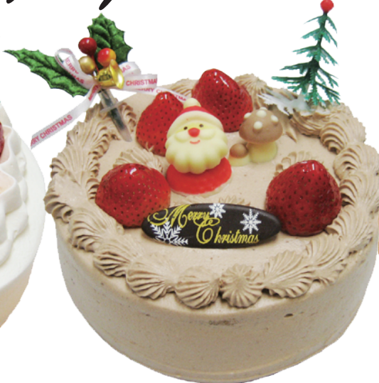
濃厚な味わい 生チョコクリーム