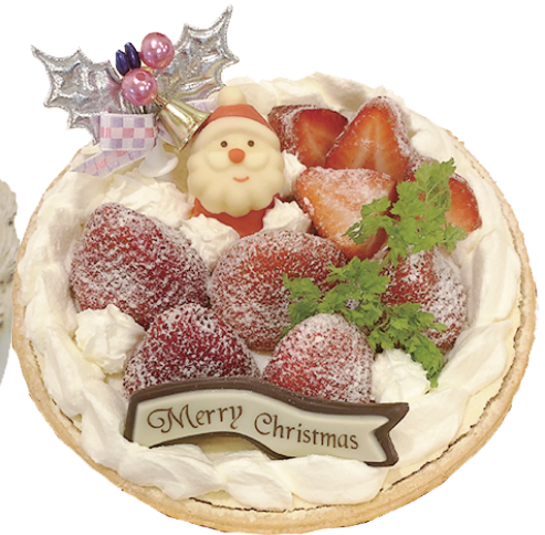
クリスマス期間限定! いちごタルト