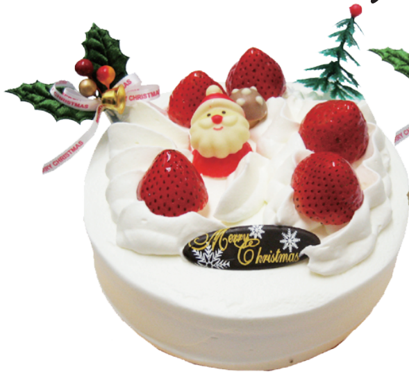
やさしい甘さ 生クリーム