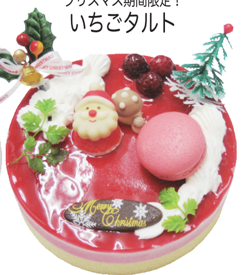
甘酸っぱ〜い 木いちごとピスタチオのムース