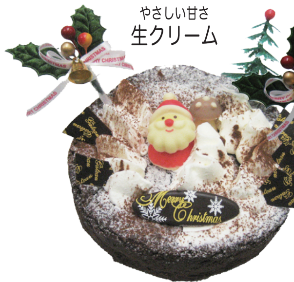
甘み抑えたオトナの味 ガトーショコラ