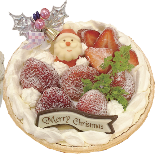
クリスマス期間限定! いちごタルト