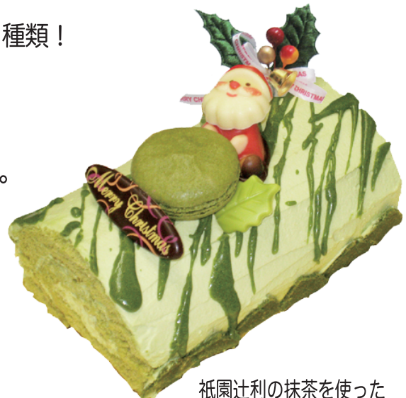
祇園辻利の抹茶を使った 抹茶のブッシュドノエル

パティスリーアミューズ http://www.patisserie-amuse.com