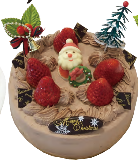
濃厚な味わい 生チョコクリーム