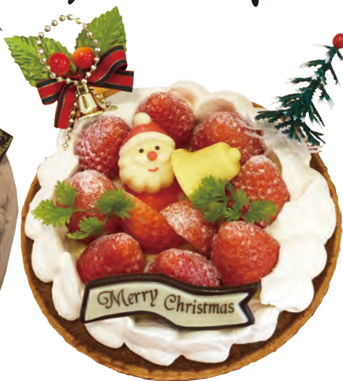
クリスマス期間限定! いちごタルト