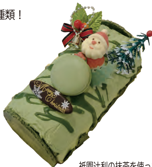
祇園辻利の抹茶を使った 抹茶のブッシュドノエル

【休業日のお知らせ】12/26(火) 1/1(月) 1/2(火) 午前中 ★2024年新年は1/2(火) 正午 OPEN★