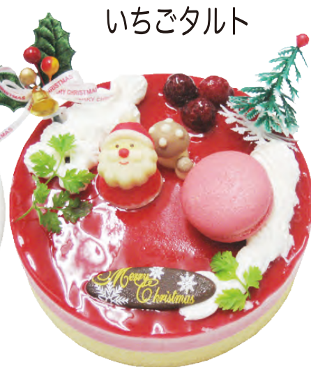
期間限定! 甘酸っぱ〜い 木いちごとピスタチオのムース