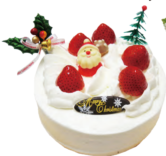
やさしい甘さ 生クリーム